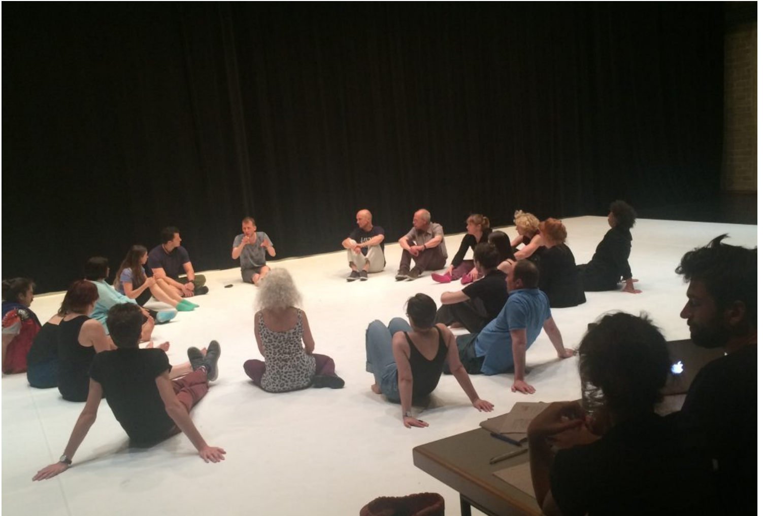
The Common People – Düsseldorf, foto Fransien van der Putt.

Dhont: “We willen graag dat de groep een afspiegeling vormt van de maatschappij. Al lukt dat niet overal. Hier in Düsseldorf zijn er bijvoorbeeld maar vier gekleurde mensen bij.”