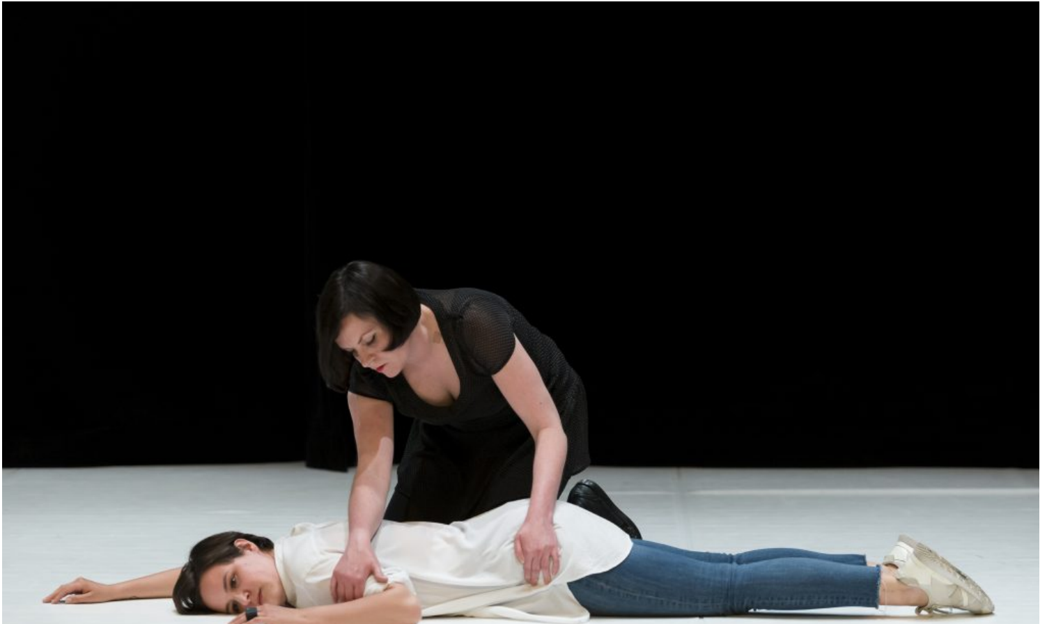
The Common People Düsseldorf, foto Katja Illner.

The Common People duurt drie uur en vindt plaats in een uiterst minimalistische setting. Alleen het subtiele lichtontwerp van Jan Fedinger geeft de ruimte iets landschappelijks, wat de spreekwoordelijke naaktheid van de optredens enigszins verzacht. De duetten duren tussen de 4 en de 10 minuten, afhankelijk van het samenspel. Verschillende tijdservaringen doorkruisen elkaar: de duetten zelf zijn uiterst geconcentreerd en relatief traag, terwijl het verloop van de avond iets flitsends heeft door de vele korte momenten, die elkaar opvolgen en in de herinnering door elkaar gaan lopen.