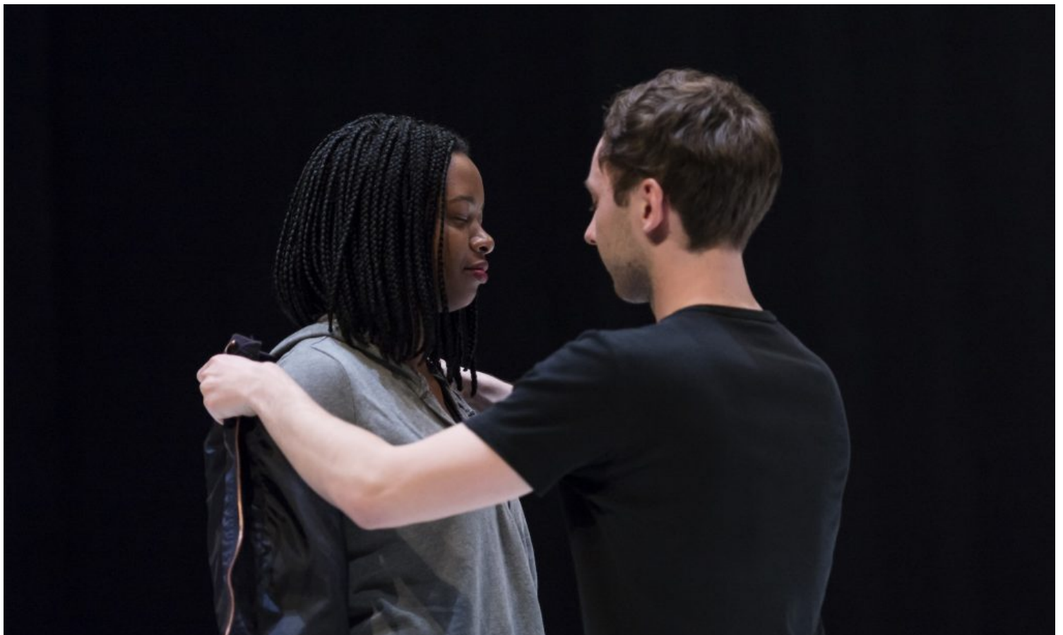
The Common People Düsseldorf.

drinken voor de duur van een of meerdere duetten of op het achterpodium grasduinen en kennismaken met de digitale identiteit van de performers. Samen met de jonge filmregisseur Lukas Dhont ensceneert Martens de concreetheid van alledaagse intimiteit, zoals die in eerste ontmoetingen tot uiting komt.