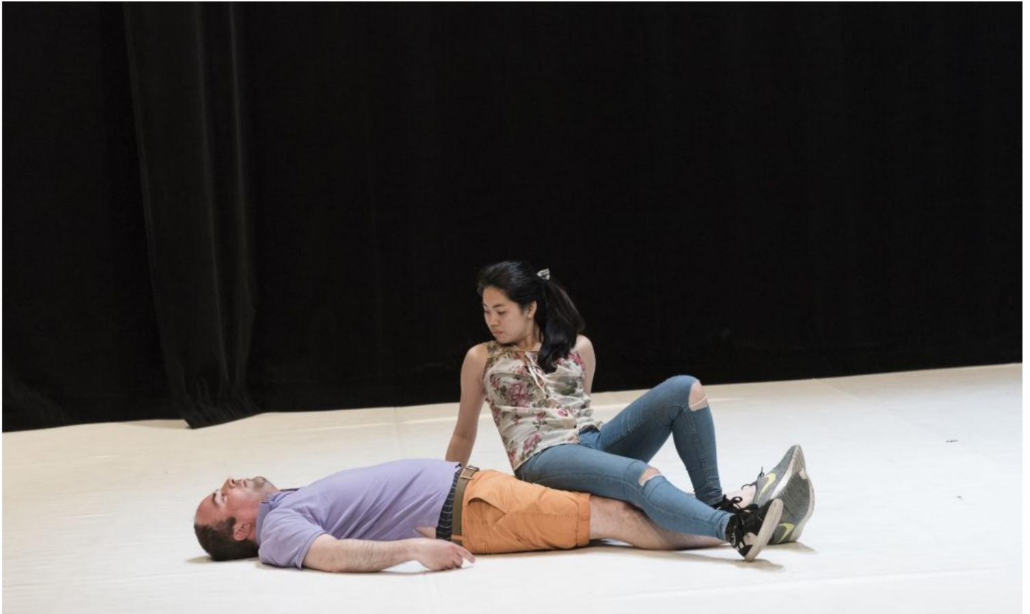
Common People – Düsseldorf

Julie schrijven dat de voorstelling een weerwoord is op het contact maken online. Is er iets mis met ons smartphone-gebruik en de vele uren die we met sociale media doorbrengen? Ik bedoel, jullie doen het zelf ook, toch?